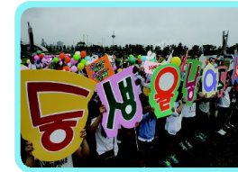
●저출산 극복을 위한 드림콘서트