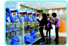
●육아용품 지원센터 운영