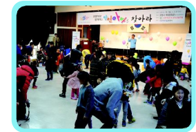
●달인 아빠를 찾아라!