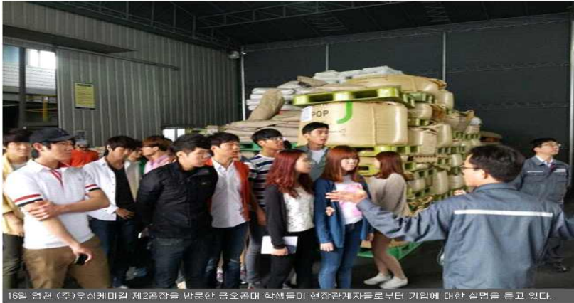
16일 영천 (주)우성케미칼 제2공장을 방문한 금오공대 학생들이 현장관계자들로부터 기업에 대한 설명을 듣고 있다.

“기업탐방기회가 자주 오진 않아요. 한 해 한번? MT(멤버십 트레이닝) 산업시찰 때가 아니면 거의 없다고 봐야죠”