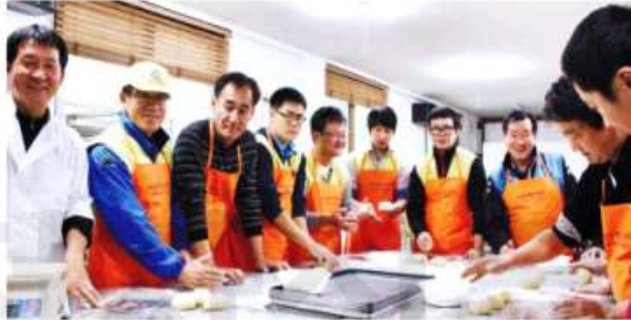
친환경 건축문화를 선도하는 포스코휴먼스 직원들이 소외아동 나눔활동을 펼치고 있다.

이 회사는 스틸하우스 사업으로 지난해 160억원이 넘는 매출을 올린 데 이어 올해는 글로벌 경제 위기에도 불구하고 200억원의 매출을 올릴 것으로 기대하고 있다. 최근 수출실적은 2억5000만원 수준으로 아직 적은 편이지만, 올해부터 신규 사업