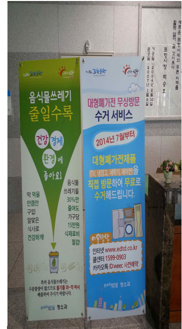
규격 : 60cm × 180cm