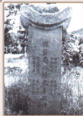
현감 남순원 선정비