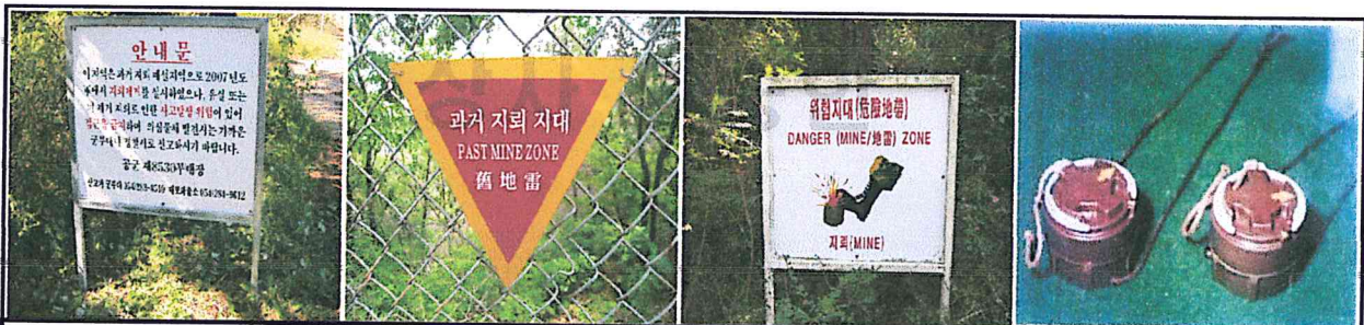
안 내 문