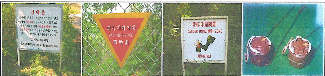
안 내 문