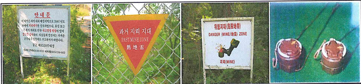
안 내 문