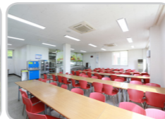
식당 (정원 120명)