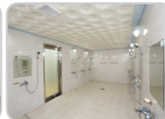
샤워실 (남, 녀 각 3개소)