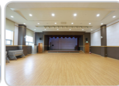
강당 (정원 100명)