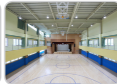
다목적체육관 (신설 정원 300명)