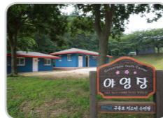
야영장 (정원 200명, 3년)