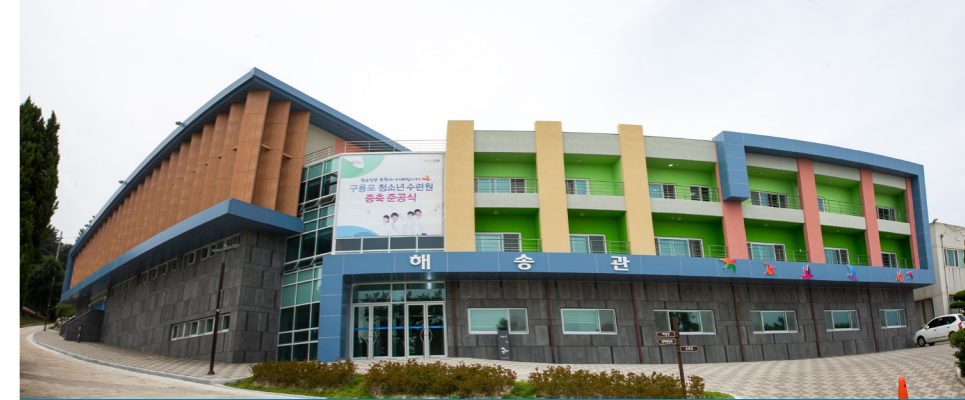
해송관 3층 가족실 펜션형 6실 완비 학년 야영 300명 이상 동시 숙박 가능!

바다·하늘·숲 탁월한 자연경관과 문학과 역사가 살아 숨 쉬는 스토리텔링의 보고 180도 이상 바다조망권을 가진 구룡포청소년수련원 해송관 증축 완공되었습니다.