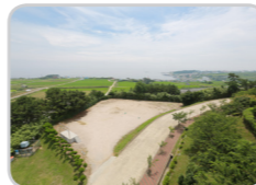
운동장 (정원 200명)