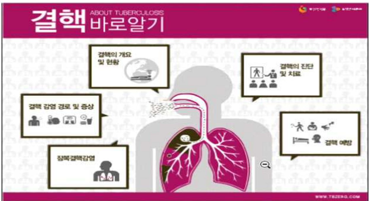
< 결핵 바로알기 (Prezi, PDF) (일반인용) >