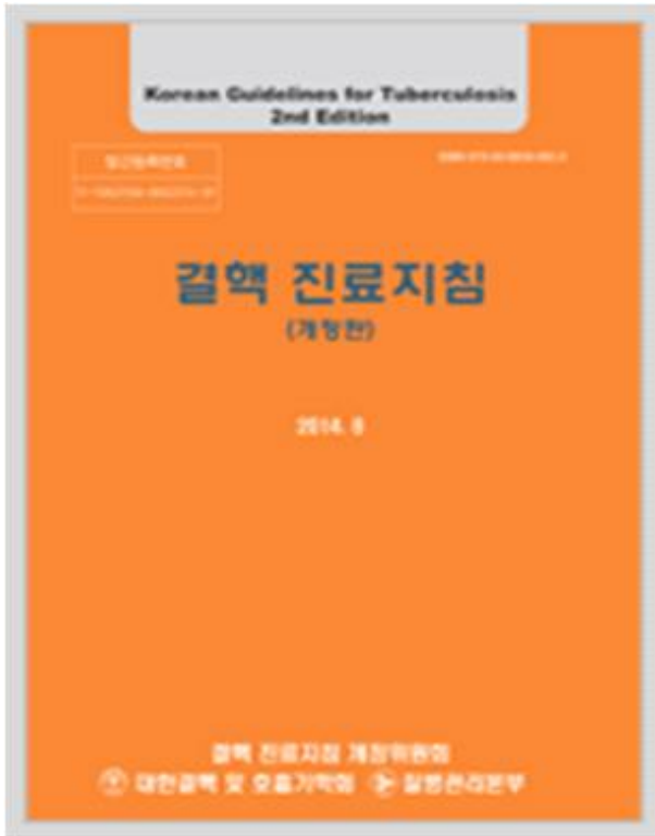
< 결핵 진료지침 (PDF) (전문가용) >

※ 다운로드 위치 : http://tbzero.cdc.go.kr -> 결핵자료