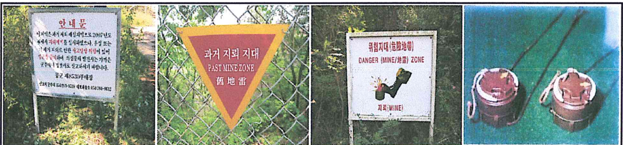
안 내 문