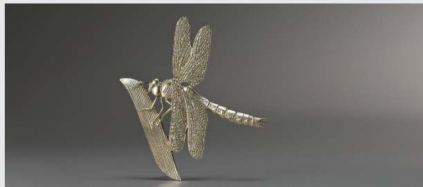
아티스트 정영신 작품