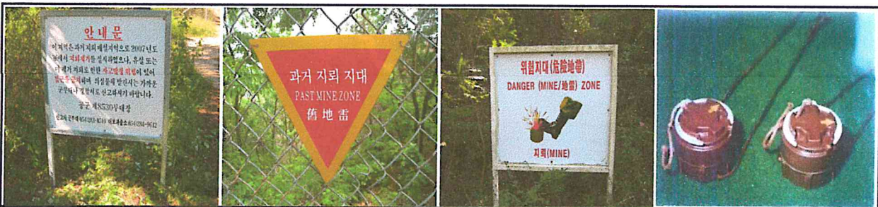
안 내 문