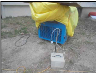
C-10 24동 음압기