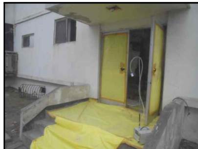
C-11 24동 폐기물반출구