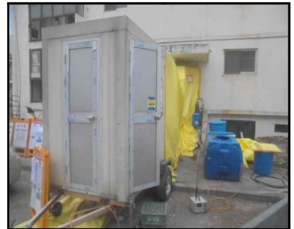
C-9 24동 위생설비