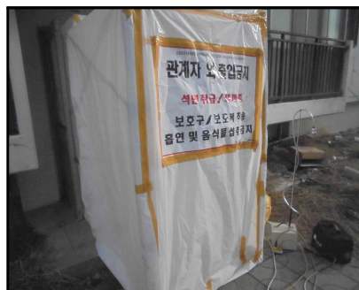
A-11 7동 위생설비