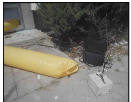
A-12 7동 음압기