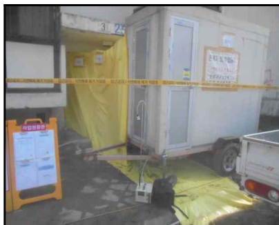
C-11 25동 위생설비