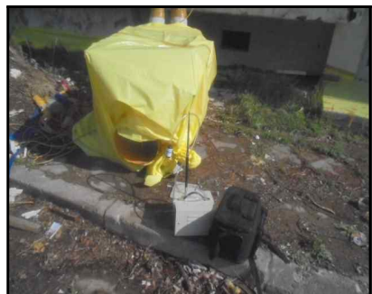
C-12 25동 음압기