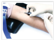
인터페론감마분비검사 (Interferon-Gamma Releasing Assay, IGRA)

혈액을 채취하여 결핵균 감염을 확인합니다. *결핵균 특이항원으로 면역세포를 자극한 후 분비되는 인터페론감마를 측정