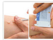
투베르쿨린 피부반응검사 (Tuberculin Skin Test, TST)

혈액을 채취하여 결핵균 감염을 확인합니다. *결핵균 특이항원으로 면역세포를 자극한 후 분비되는 인터페론감마를 측정