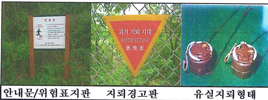
안내문/위험표지판 지뢰경고판 유실지뢰형태