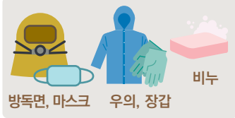
방독면, 마스크 우의, 장갑 비누