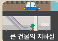
큰 건물의 지하실