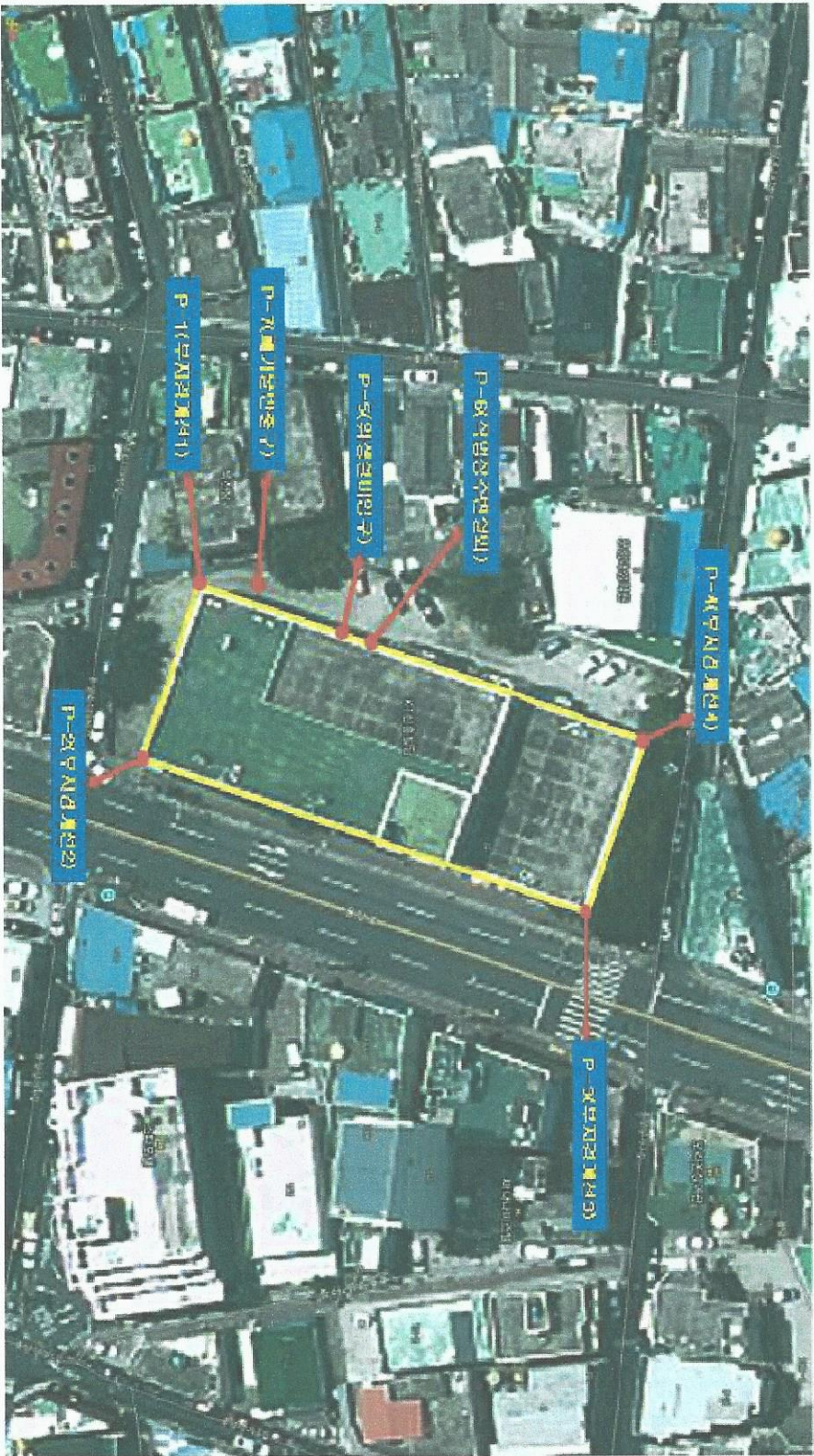
6-3. < 축정 위치 >