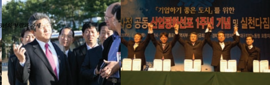
4 | 5 | 6