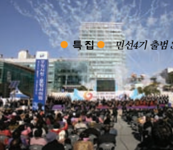
● 특 집 ● 민선4기 출범 3년의 보람과 과제