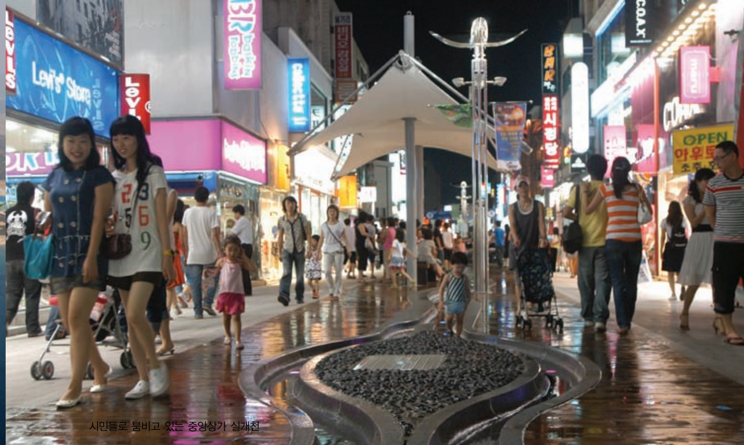
시민들로 붐비고 있는 중앙상가 설계전