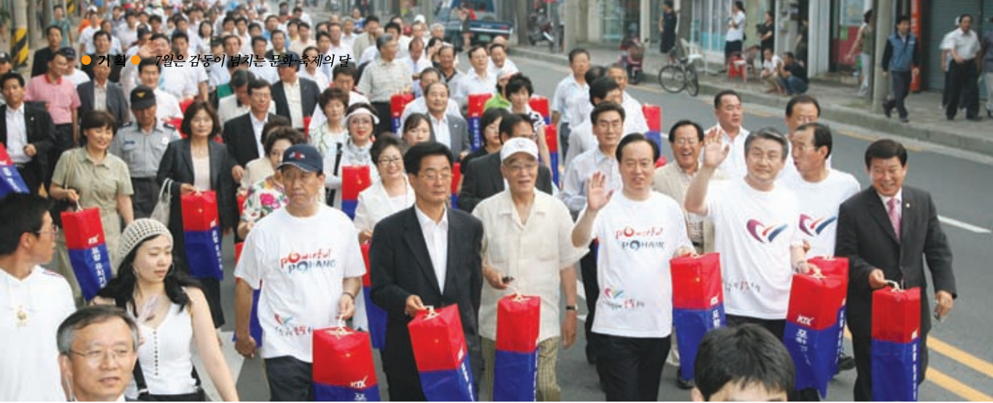
● 기획 ● 7월은 감동이 넘치는 문화 축제의 달