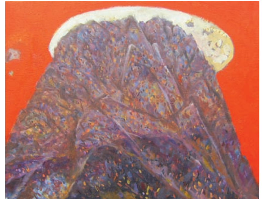
| 제목 | 산200906 | 크기 | 110p | 재료 | Oil color