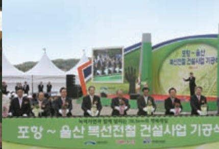
7 | 8 | 9

무엇보다 노사정이 함께 산업평화를 선포하면서 기업투자유치의 실마리가 풀리기 시작했다. 이를 신호탄으로 강림중공업, 참엔씨 등 국내 굴지의 중견기업들이 앞 다투어 포항투자를 발표했다.