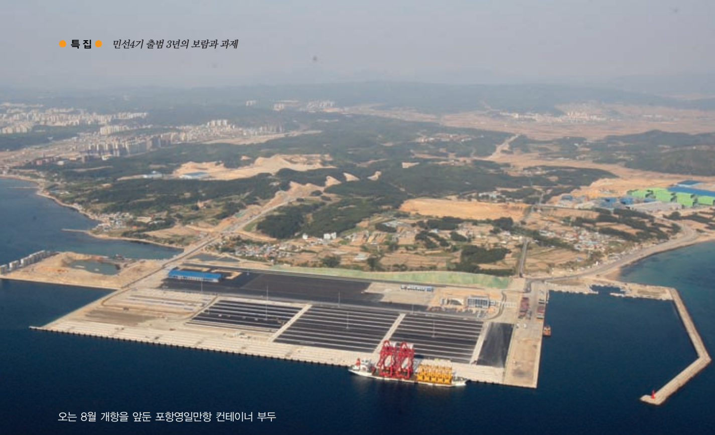
오는 8월 개항을 앞둔 포항영일만항 컨테이너 부두