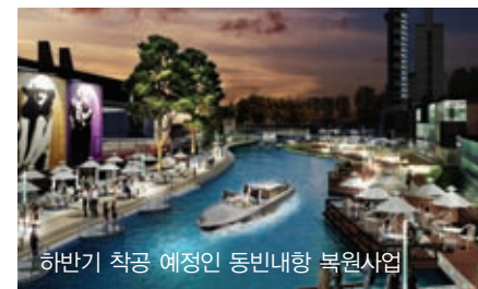
하반기 착공 예정인 동빈내항 복원사업