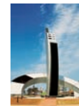
시승격60주년 기념조형물 사진 • 정미향

• 발행처 : 포항시 | 발행인 : 포항시장 박승호 • 편집인 : 공보담당관 방진모 • 편집담당 : 홍보기획팀장 김동완, 김경란 • 담당주소 : 경상북도 포항시 남구 시청앞길 100 Tel : 054 · 270 · 2334 • 발행일 : 2009년 6월 25일 • 기획·편집 | (주)금강미디어 Tel : 054 · 275 · 0558 • 인쇄 | 남진인쇄 Tel : 054 · 274 · 1567 • 홈페이지 : www.ipohang.org ※ 열린포항은 포항시 홈페이지에서도 보실 수 있습니다