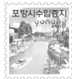
흑백프린트 출력시 문양