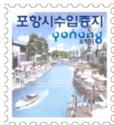
칼라프린트 출력시 문양