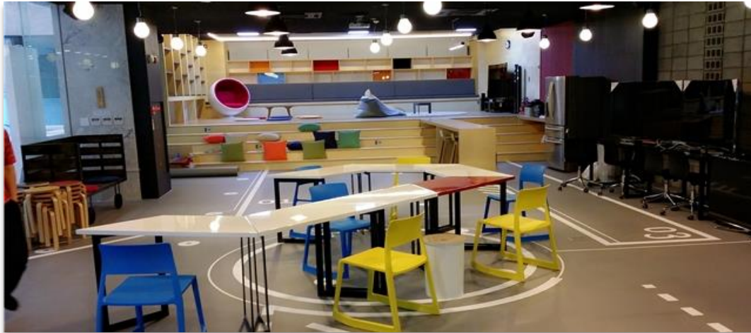
② C-Lab 내부