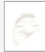
오천원권, 일만원권 숨은그림