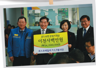
포스코패밀리 P.C.P 봉사단